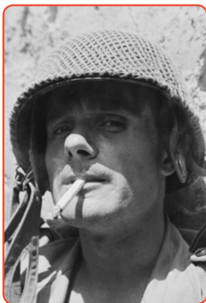
Pierre Schoendoerffer, mars 1954, Indochine.