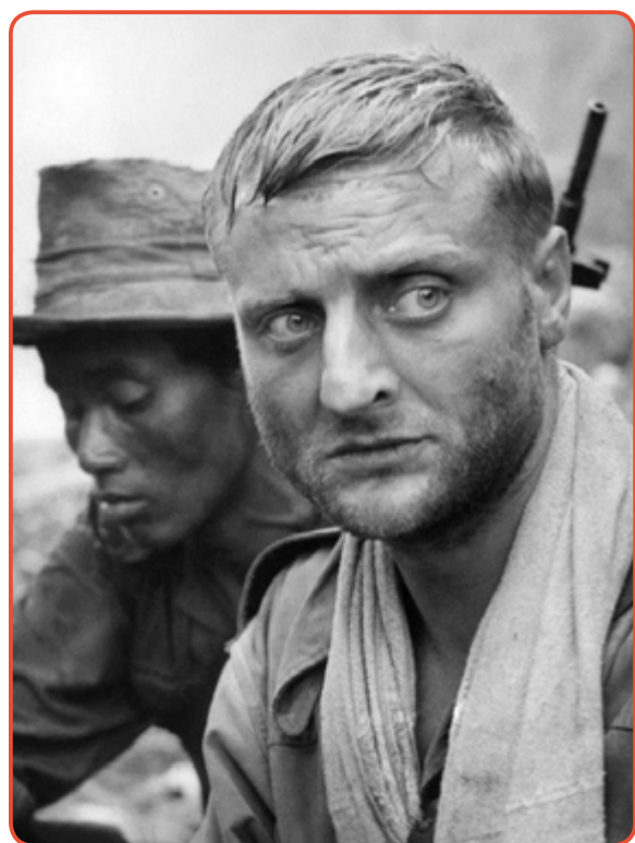
Le comédien Bruno Crémer

Au Festival de Cannes, le film remporte la palme du meilleur scénario. Plus de cinquante ans plus tard, il est le seul, sur ce sujet, à être passé à la postérité. Il est aussi le commencement de l'épopée des personnages schoendoerfferiens qui ne s'achève qu'en 2004 avec la sortie au cinéma de Là-Haut , adapté du roman éponyme.