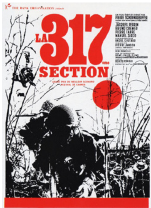
Affiche du film, collection particulière.

La 317 e section naît de l'intention de Pierre Schoendoerffer de raconter la guerre qui l'a fait devenir homme. Né en 1922, cameraman des armées en Indochine entre 1952 et 1954, il a connu des facettes multiples du conflit, en suivant des soldats français de tout grade, des politiques et en côtoyant des Vietnamiens. L'expérience du combat demeure gravée dans son esprit, achevée par l'épreuve indélébile de Diên Biên Phu et de la captivité. L'idée de raconter la vie des soldats français dans cette guerre le taraude. Il écrit un scénario qu'il présente au producteur Georges de Beauregard avec qui il a déjà travaillé. Celui-ci n'y voit qu'une « histoire de boy-scout » et refuse le projet. Pierre Schoendoerffer décide alors d'en faire un livre, publié en 1963 à la Table-Ronde. À la lecture du roman, Beauregard change finalement d'avis. Débute alors une aventure hors du commun, avec un budget dérisoire, dévoré par les autres films produits par Beauregard au même moment.