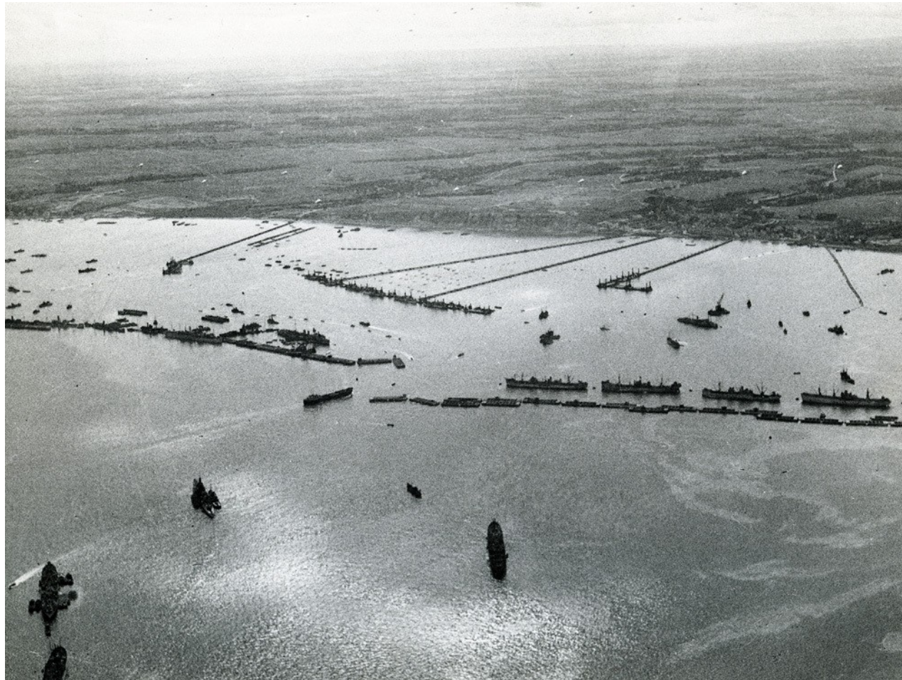
*port d'Arromanches vue du ciel