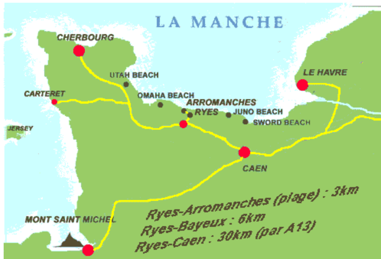
Carte représentant les différentes plages du débarquement et la ville d'Arromanches