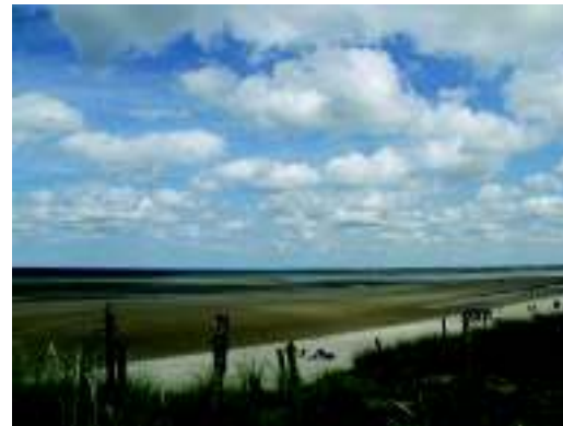
Utah Beach de nos jours