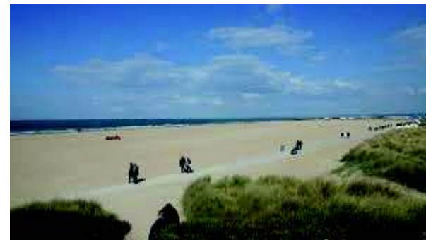
Sword Beach de nos jours