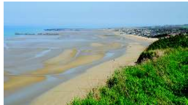
Gold Beach de nos jours