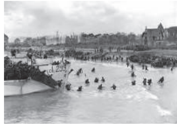
Juno Beach, 1944

Les pertes canadiennes (morts, disparus blessés) s'élèvent à environ mille hommes.