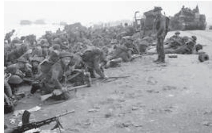
Sword Beach, 1944

Les Britanniques débarquent, avec environ 180 français qui s'étaient enfuis lors de la défaite de la France en 1940, à 7h25. Les Alliés ont progressé assez facilement puisqu'il y a eu peu de victimes ( 700 sur un total 30 000 hommes débarqués). De plus, le jour suivant, ils rejoignent les forces canadiennes de Juno.