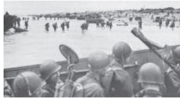
Utah Beach, 1944

Les Américains ont débarqué sur la plage d'Utah le 6 juin 1944 à 7h30. Etant beaucoup moins fortifiée que les autres plages, elle a été plus simple à prendre et moins meurtrière (200 victimes) que les autres. A la fin de la première journée, ses résultats sont les plus proches des objectifs initiaux des Alliés.