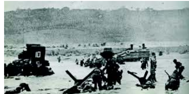
Omaha Beach, 1944

A cause des conditions météo non favorables au plan initial, celui-ci a échoué et les bombes, censées préparer le terrain, ont été larguées en ville. Les soldats américains qui ont débarqué sur la plage d'Omaha, le 6 juin 1944 à 6h30, découvrent une plage lisse, ce qui a facilité l'attaque ennemie. De plus, le paysage était constitué de falaises. Les Allemands s'étaient appropriées les côtes normandes et gardaient leurs positions pour attendre d'attaquer les Alliés. Cette bataille fut très meurtrière(1000 morts et 2000 blessés et disparus). Depuis ce jour, elle est surnommée « Bloody Omaha » ou Omaha la sanglante en français.