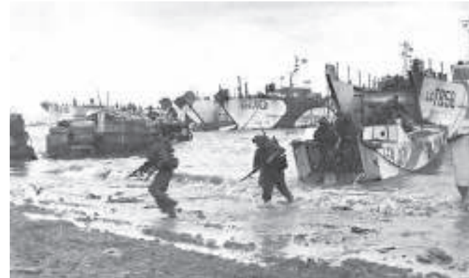
Gold Beach, 1944

Sur la plage de Gold, les Britanniques ont débarqué le 6 juin 1944 à 7h30. Cette plage est au centre de la zone de débarquement. Elle est encadrée de falaises. Comme sur les plages d'Utah et d'Omaha, des bombardements aériens ont eu lieu pendant la nuit du 5 au 6 juin, pour préparer le terrain. Le but des Britanniques était de s'emparer de la plage et prendre Bayeux.