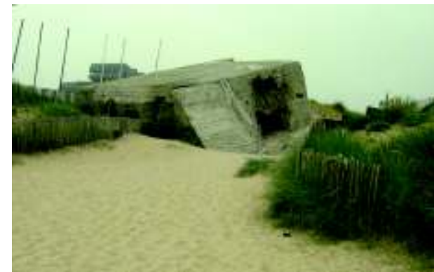
Juno Beach de nos jours