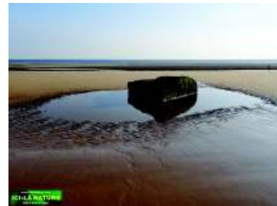
Omaha Beach de nos jours