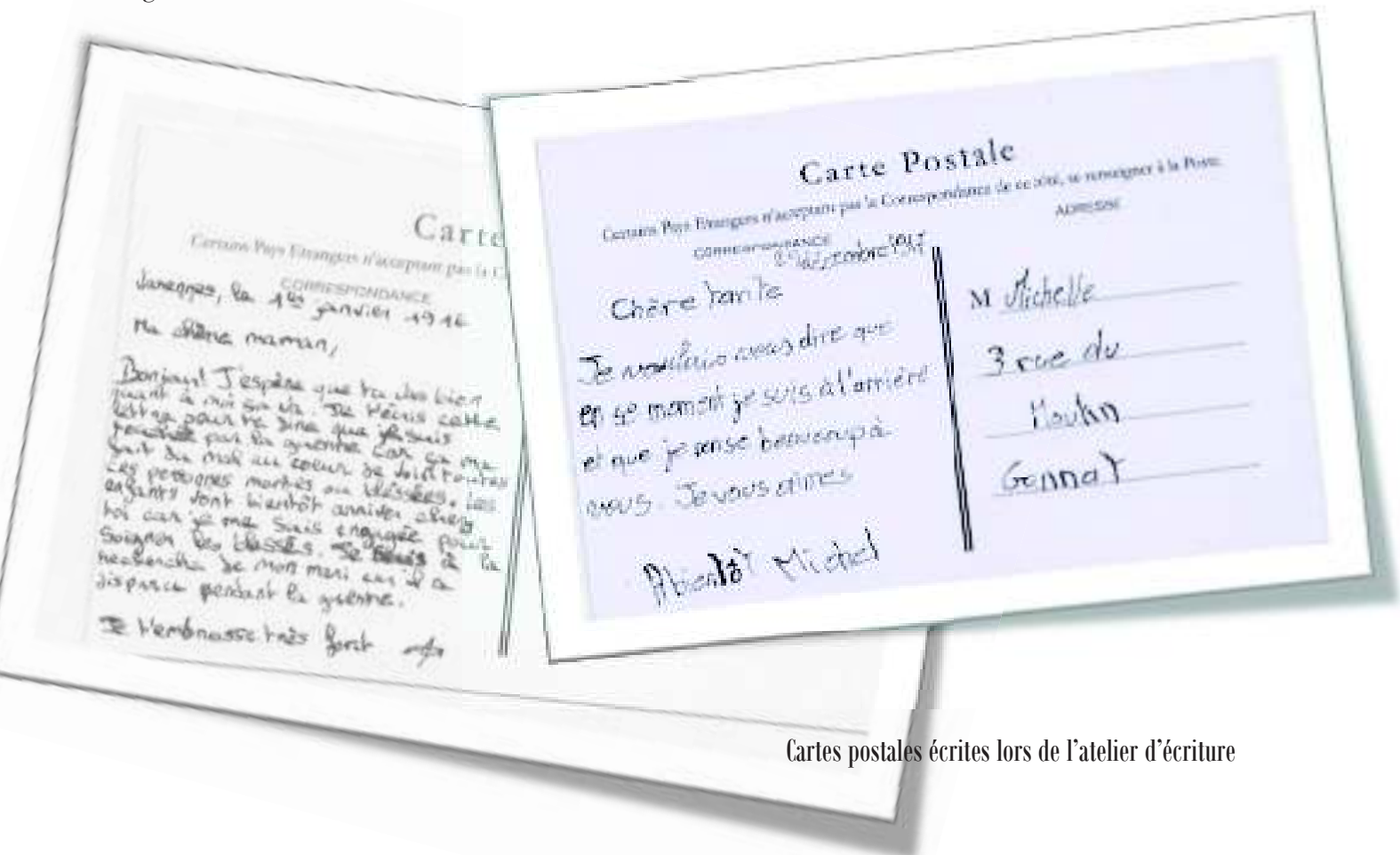
Cartes postales écrites lors de l'atelier d'écriture

Après le parcours de la visite, on vous montre un montage qui dure 10 minutes environ et qui est réalisé en 3D (pas besoin de lunettes) pour raconter l'histoire de ces hommes. Ce montage vidéo permet de comprendre leurs histoires et quelles étaient leurs conditions de vie. Certains hommes sont devenus fous tellement ils étaient terrifiés par la peur de mourir.