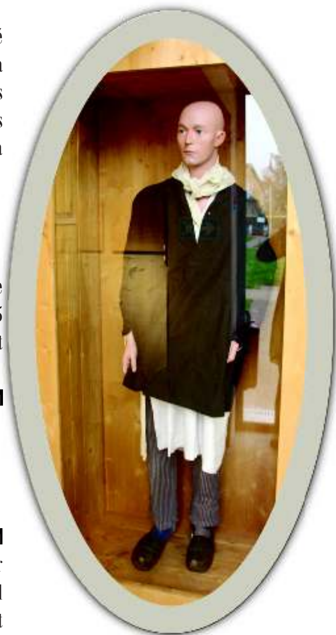
Vêtements du paysan bourbonnais

L'état reconnaît les sacrifices de ses soldats et les décorant de médailles qui honorent leur courage, Chaque commune de France rend également hommage à ses victimes en érigeant son propre monument aux morts.