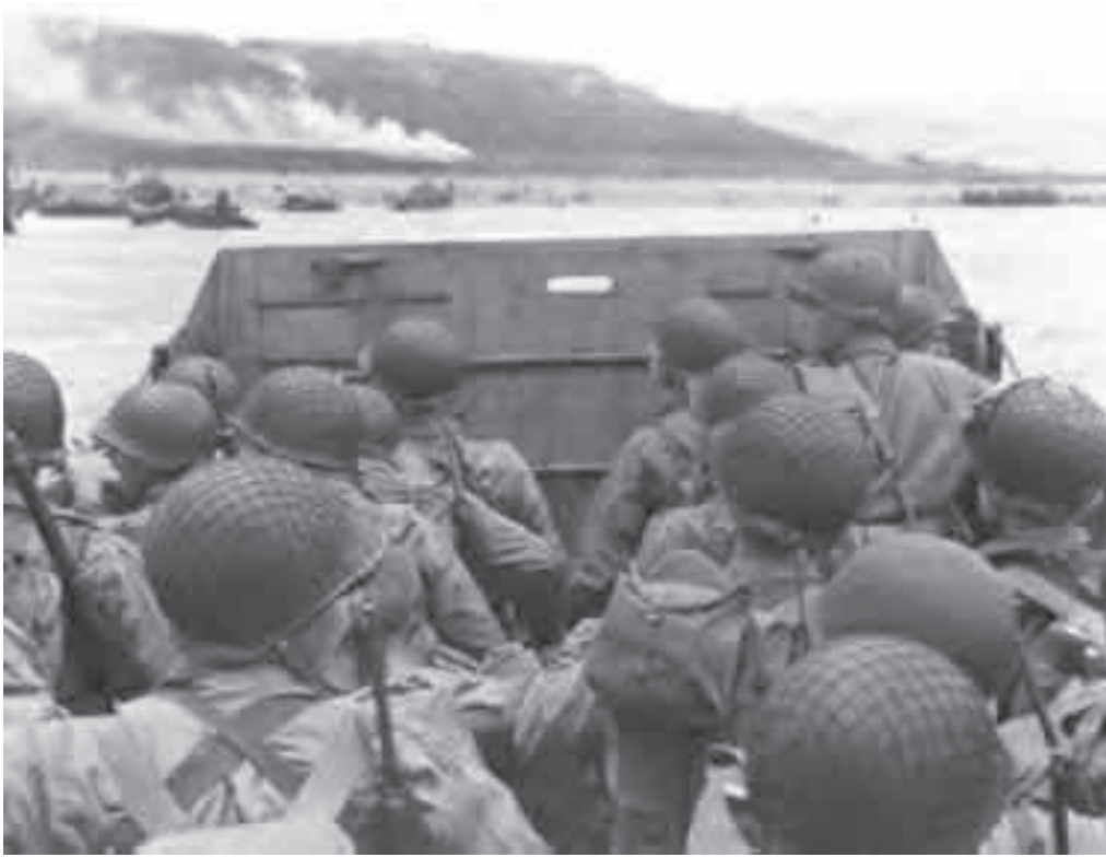
Les Américains arrivent sur la plage à 6h30.

Quand la rampe de la barque s'ouvre les Américains sortent et ils sont en difficultés à cause des tirs des Allemands, et certains Américains se noient car leurs poids de leur équipement est très lourd ou parce que y a une tempête.