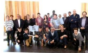
Partenaires, professeurs et élèves, réunis pour échanger la République.

Dans le cadre du projet "2016, année de la République", des élèves de l'établissement d'enseignement adapté Éric Tabarly ont présenté leur réflexion.