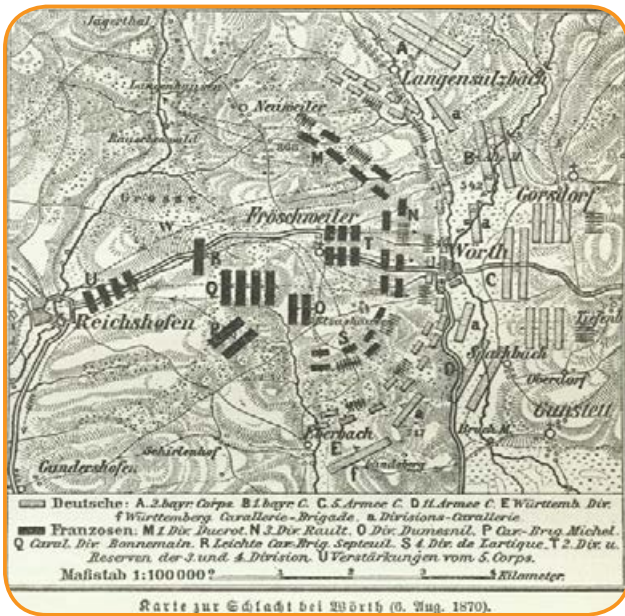
Carte de la bataille. Domaine public.

Plan de la bataille de Froeschwiller-Woerth.