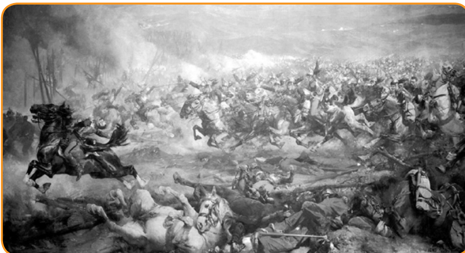
Charge du 3 e régiment de cuirassiers français à Woerth.

Formé de quatre divisions d'infanterie, il est déployé à la fin du mois de juillet entre Froeschwiller, Haguenau et Strasbourg. Du côté allemand, le 30 juillet, après une période de montée en puissance, l'état-major général prescrit à la III e Armée du prince royal de Prusse de se porter en avant et de pénétrer en Alsace. Le 4