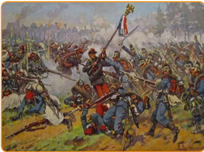
Carte postale allemande de propagande datant de 1880-1910 représentant la prise d'un aigle à Woerth par le 2 e Bavaïois. Collection personnelle.