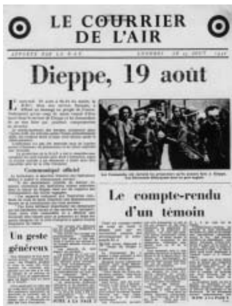
Tract du Courrier de l'Air délivré par l'aviation britannique relatant l'opération.