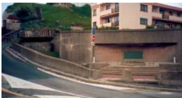
Monument dédié au Royal Regiment of Canada et les blockhaus allemands qui tiraient à vue sur la plage, Puys.

Ministère de la défense Secrétariat général pour l'administration Direction de la mémoire, du patrimoine et des archives 14, rue Saint-Dominique 00450 ARMÉES