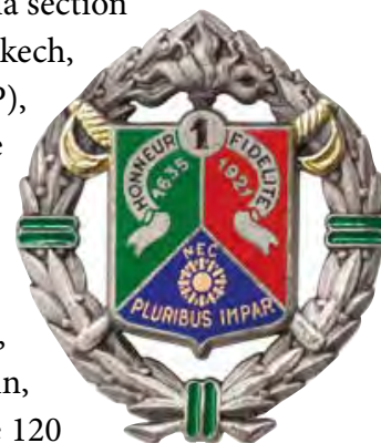
Insigne du 1 er REC. Collection particulière.

Obus de mortiers, rafales de mitrailleuses et coups de canons de 106 ciblent la section de l'adjudant Allouche. Il est midi lorsque ce sous-officier, jeune pied-noir de Marrakech, est touché mortellement. Sous les ordres du lieutenant-colonel Lhopitallier (2 e REP), la riposte française est immédiate appuyée notamment par des avions Jaguars. Une heure d'échanges de feu très nourris entre les deux rives du Batha va ébranler les positions rebelles avant que l'ordre de l'assaut ne soit donné aux environs de 13h30. Le 20 mai, au lever du jour, rejoint la veille par le 1 er escadron du REC, le détachement français pénètre dans Ati et constate que les rebelles ont évacué la ville, emportant leurs blessés. Le bilan ennemi est lourd : 80 cadavres laissés sur le terrain, 65 armes individuelles, 6 mitrailleuses, 1 mortier de 81 millimètres et un second de 120 millimètres, 1 bitube de 14,7 millimètres et un canon de 75 sans recul.