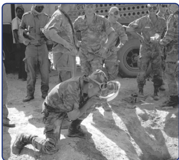
Patrouille accompagnée d'un caméraman aux alentours du village de Sehabaya, février 1970, région de Batha, centre du Tchad.

La bataille d'Ati marque le point clé de la seconde phase de l'opération Tacaud . Malgré leurs pertes, les rebelles ne renoncent pas à poursuivre leur offensive vers le Sud. Les combats de Djedaa, à 50 kilomètres au nord d'Ati, menés également par le groupement du colonel Hamel, et les pertes à nouveau subies par l'ennemi, rétablissent ponctuellement le calme, permettant la mise en place d'un plan de réconciliation nationale et la signature d'une charte fondamentale. Mais fin décembre, la capitale devient l'enjeu de nouveaux affrontements entre les forces du président Malloum et celles d'Habré. La France doit alors contribuer à séparer les factions opposées.