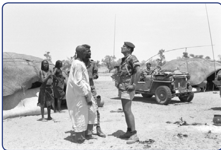
Au Tchad, une patrouille conjointe entre le 1 er REC et la gendarmerie tchadienne s'arrête dans un village de nomades, juin 1978.

Dans la nuit du 18 au 19 mai, un message en provenance de la gendarmerie d'Ati rend compte que la ville a été prise par les rebelles en fin d'après-midi du 18. Une reconnaissance aérienne par deux avions Jaguars n'y décele pourtant rien. Cependant, après analyse des photos rapportées par les deux appareils, il est clair que la ville est tenue par un fort parti adverse, équipé d'armes lourdes dont des bitubes de 14,7 millimètres et des jeeps avec canon de 106 millimètres sans recul.